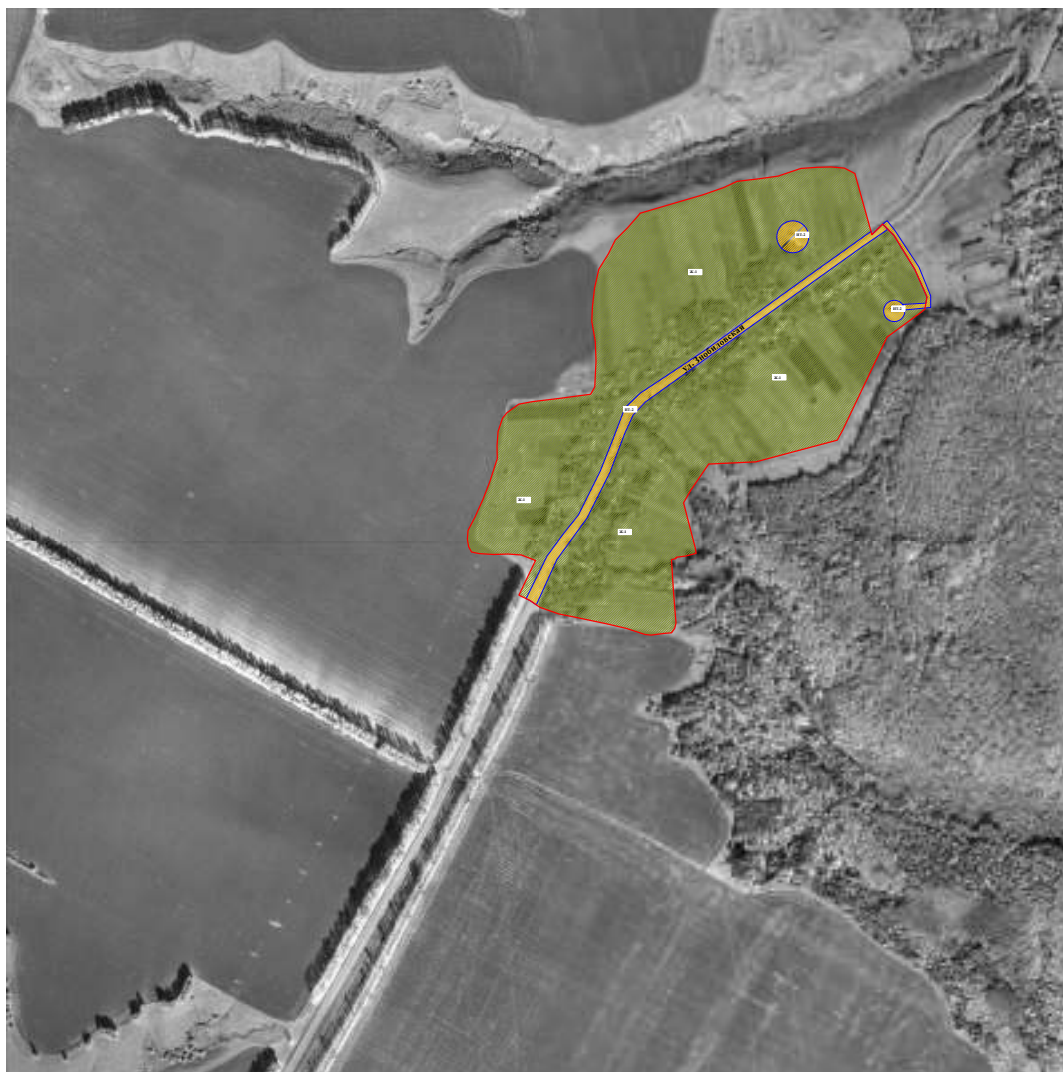
Схема градостроительного зонирования с. Знобиловка М 1 : 5 000

Муниципального образования Паревский сельсовет Инжавинского района Тамбовской области